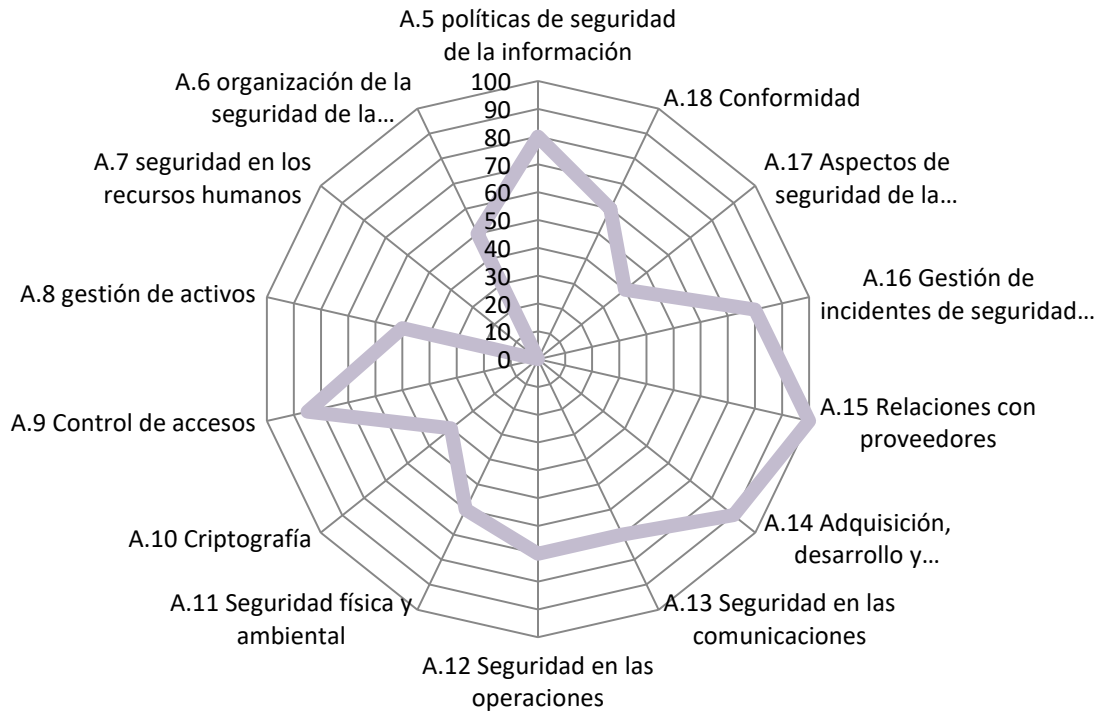
GRÁFICA RADIAL CONTROLES ANEXO A 27002:2013

En el documento anexo se pueden verificar el análisis realizado.